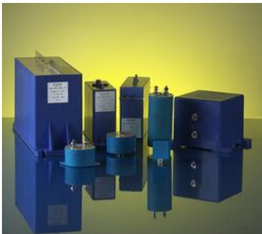
— ICAR DC-BUS-Kondensatoren Serie LNK

Deutlich höhere Stromverfügbarkeit pro Kapazitätswert (Ampère pro µF), in weniger als dem halben Volumen herkömmlicher Metallfilm-Kondensatoren, dass offeriert ICAR (Kondensatoren-Hersteller aus Monza) in der Serie LNK. Möglich geworden dank einem neuartigen, patentierten Metallisierungsprozess