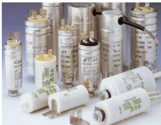
ICAR AC-Betriebs-Kondensatoren Serie MLR

ICAR... ein europäischer Hersteller für metallisierte Polypropylenfilm- / Papier-Folien-Kondensatoren, aus Monza (Italien), produziert die bewährten, qualitativ hochwertigen Betriebs-Kondensatoren-Serien MLR25. Angeboten werden die Kondensatoren in Alu-Bechergehäusen und vergossenem Kunststoffgehäusen, mit Kapazitäten von 1 - 120 \mu F. Die zylindrischen Alu-Bechergehäuse sind mit einem Überdruck-Abschaltsystem (FPU) ausgestattet.