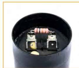
Resistenza di scarica Discharge resistor