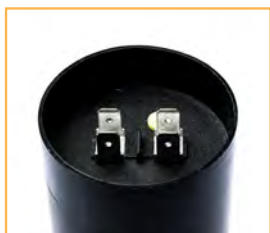
Faston doppio Double faston

Certifications: UL for the whole CME series on request; IMQ for the CME5 and CME7 series from 21 μF to 156 μF.