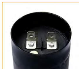
Faston singolo Single faston