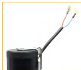
Cavo bipolare Bipolar wire