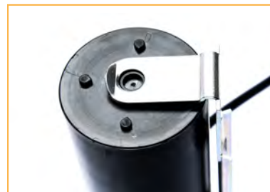
Staffa disponibile a richiesta per condensatori di altezza 85 e 111 mm Bracket available on request for 85 and 111 mm capacitors height