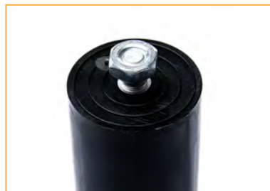
Codolo filettato M8 disponibile a richiesta nelle misure 38x85 e 46x85 M8 stud available on request for 38x85 And 46x85 capacitors