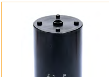
Tutti i condensatori della serie CME sono disponibili con fondo piatto All the CME series are available with flat case

Certifications: UL for the whole CME series on request.